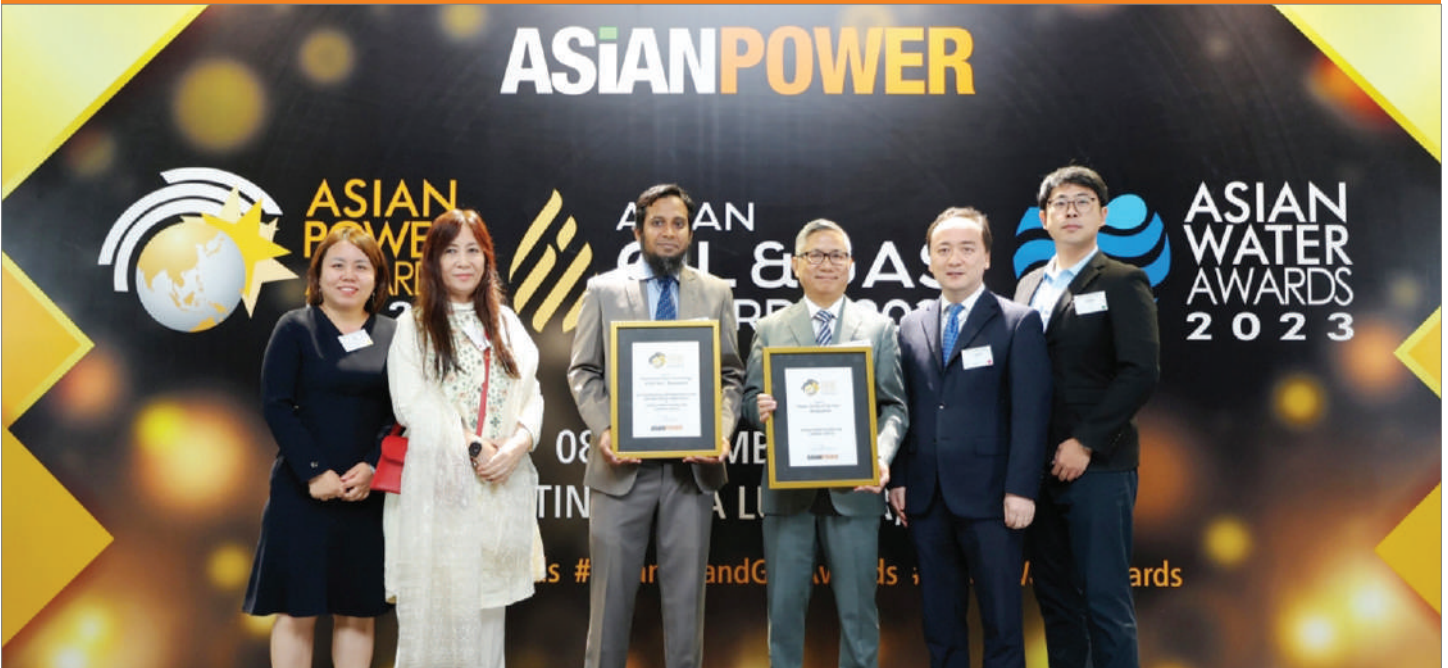
বাংলাদেশের ১ম প্রতিষ্ঠান হিসেবে এশিয়ান পাওয়ার অ্যাওয়ার্ডস ২০২৩ অর্জন করেছে ডিপিডিসি

ঢাকা পাওয়ার ডিস্ট্রিবিউশন কোম্পানি লিমিটেড (ডিপিডিসি) বাংলাদেশের ১ম প্রতিষ্ঠান হিসেবে এশিয়ান পাওয়ার অ্যাওয়ার্ডস ২০২৩ অর্জন করেছে। ডিপিডিসি'র জিওগ্রাফিক্যাল ইনফরমেশন সিস্টেম ম্যাপিং প্রকল্প 'ইনোভেটিভ পাওয়ার টেকনোলজি অফ দ্য ইয়ার' ক্যাটাগরিতে এবং জনাকীর্ণ এলাকায় সিঙ্গেল পোল ট্রান্সফারমার স্থাপন সংক্রান্ত উদ্ভাবনের জন্য 'পাওয়ার ইউটিলিটি অফ দ্য ইয়ার' ক্যাটাগরিতে এই পুরস্কার অর্জন করে।