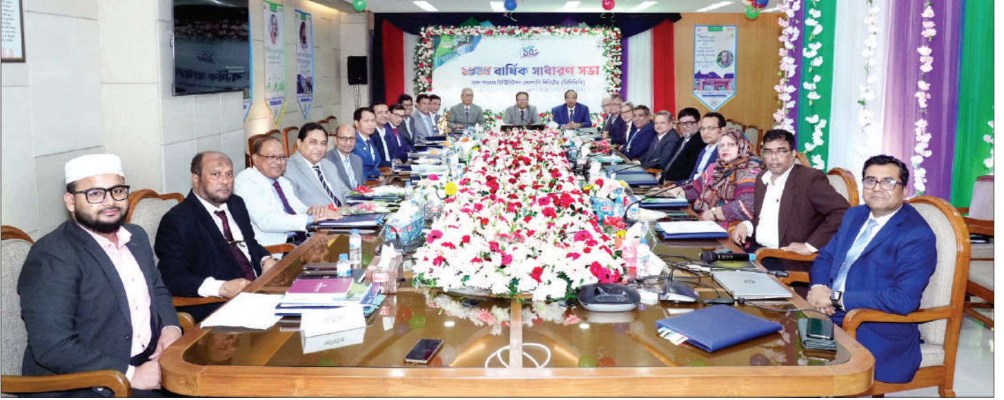
ঢাকা পাওয়ার ডিস্ট্রিবিউশন কোম্পানি লিমিটেড (ডিপিডিসি)-এর ১৮তম বার্ষিক সাধারণ সভা