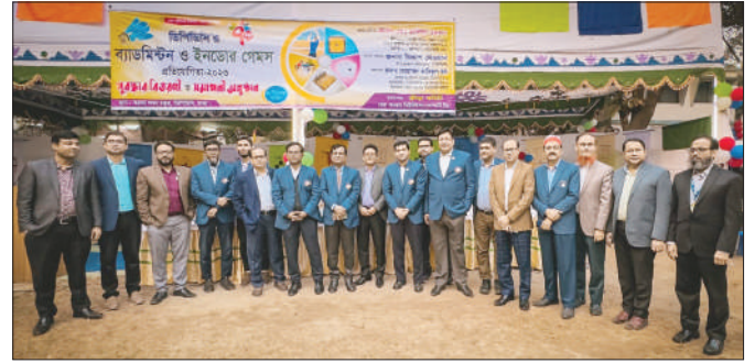
ব্যাডমিন্টন ও ইনডোর গেমসের বিভিন্ন ইভেন্টে ডিপিডিসি’র বিভিন্ন পর্যায়ের শতাধিক কর্মকর্তা-কর্মচারী অংশগ্রহণ করেন।

আয়োজনের জন্য গেমসের সাথে যুক্ত সকলকে ব্যবস্থাপনা পরিচালক আন্তরিক শুভেচ্ছা জ্ঞাপন করেন এবং ভবিষ্যতে এমন বিনোদনমূলক কর্মকাণ্ড আরও বেশি আয়োজনের পরামর্শ প্রদান করেন। পুরস্কার বিতরণী অনুষ্ঠানে ডিপিডিসি’র সকল নির্বাহী পরিচালক, প্রধান প্রকৌশলীসহ উর্ধ্বতন কর্মকর্তাগণ উপস্থিত ছিলেন।