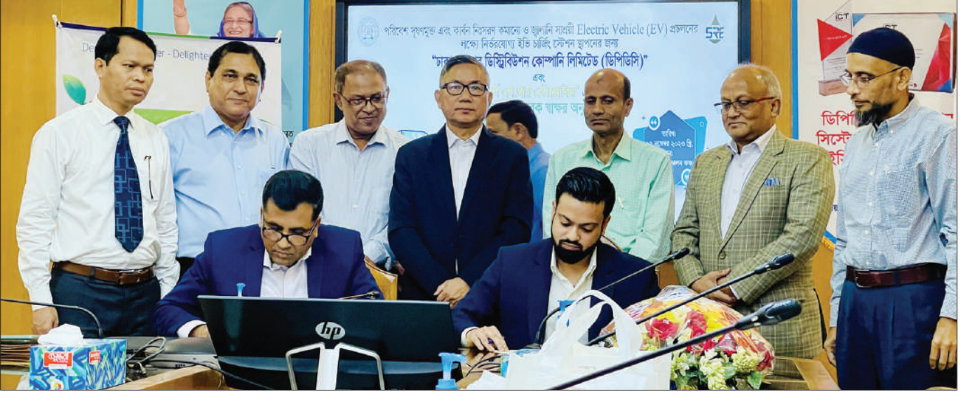
ডিপিডিসি ও মেসার্স এস.আর. এন্টারপ্রাইজের মধ্যে বৈদ্যুতিক গাড়ির চার্জিং স্টেশন স্থাপনে চুক্তি স্বাক্ষর

“সহজতর চার্জিং, দূষণমুক্ত ড্রাইভিং” প্রতিপাদ্য নিয়ে বৈদ্যুতিক গাড়ি চার্জিং স্টেশন স্থাপন করার জন্য ঢাকা পাওয়ার ডিস্ট্রিবিউশন কোম্পানি লিমিটেড (ডিপিডিসি) ও মেসার্স এস.আর. এন্টারপ্রাইজ এর মধ্যে সমঝোতা স্মারক স্বাক্ষরিত হয়।