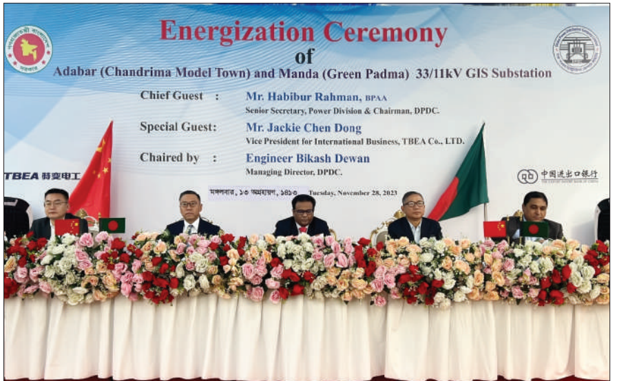
নবনির্মিত সাবস্টেশন দুটি উদ্বোধন অনুষ্ঠান

অনুষ্ঠানে ডিপিডিসি’র নির্বাহী পরিচালক, প্রধান প্রকৌশলীসহ উর্ধ্বতন কর্মকর্তাগণ ও প্রকল্প সংশ্লিষ্ট সকল কর্মকর্তা উপস্থিত ছিলেন।