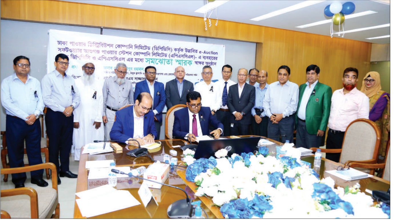
ডিপিডিসি ও এপিএসসিএল এর মধ্যে সমঝোতা স্মারক স্বাক্ষর অনুষ্ঠান

ঢাকা পাওয়ার ডিস্ট্রিবিউশন কোম্পানি লিমিটেড (ডিপিডিসি) উদ্ভাবিত ই-অকশন সফটওয়্যার আওতাধীন পাওয়ার স্টেশন কোম্পানি লিমিটেড (এপিএসসিএল)-এ ব্যবহারের উদ্দেশ্যে ডিপিডিসি ও এপিএসসিএল এর মধ্যে একটি সমঝোতা স্মারক গত ২০/০৮/২০২৩ ডিপিডিসি'র সম্মেলন কক্ষে স্বাক্ষরিত হয়।