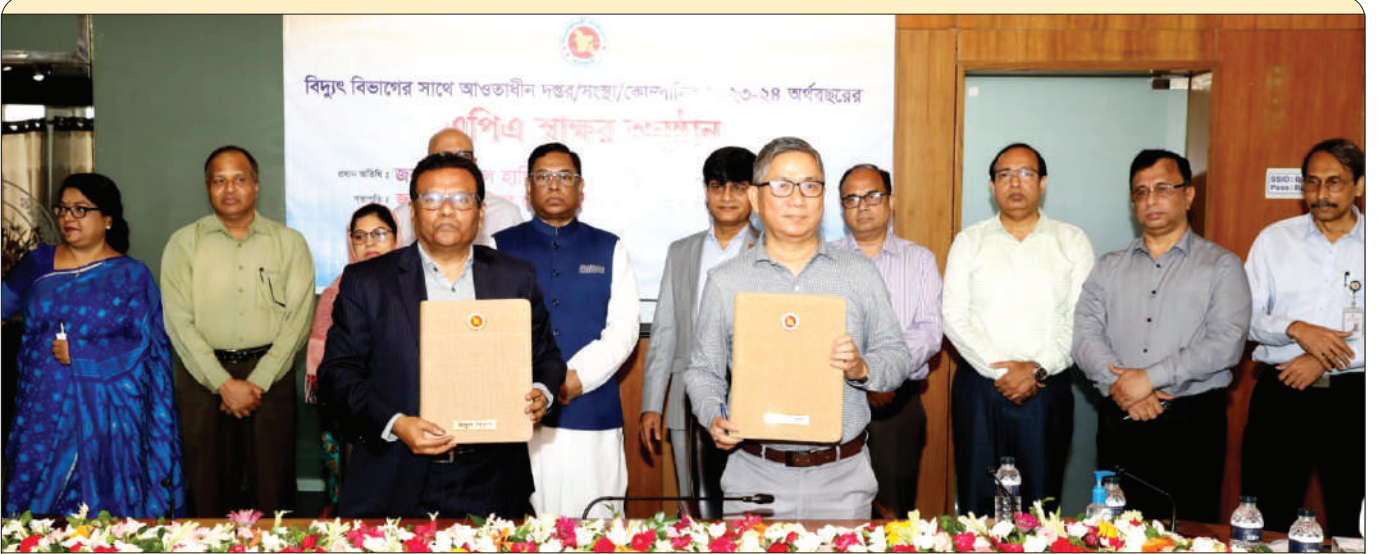
ঢাকা পাওয়ার ডিস্ট্রিবিউশন কোম্পানি লিমিটেড (ডিপিডিসি) ও বিদ্যুৎ বিভাগ, বিদ্যুৎ জ্বালানি ও খনিজ সম্পদ মন্ত্রণালয়-এর মধ্যে ২০২৩-২০২৪ অর্থ বছরের বার্ষিক কর্মসম্পাদন চুক্তি (এপিএ) স্বাক্ষরিত হয়। এপিএ স্বাক্ষর অনুষ্ঠানে বিদ্যুৎ জ্বালানি ও খনিজ সম্পদ মন্ত্রণালয়ের মাননীয় প্রতিমন্ত্রী জনাব নসরুল হামিদ, এমপি উপস্থিত ছিলেন।