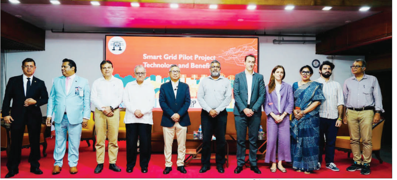
“Smart Grid Pilot Project Technology and Benefits” শীর্ষক ওয়ার্কশপ

ডিপিডিসি'র সহায়তায় ইউনাইটেড ইন্টারন্যাশনাল ইউনিভার্সিটি (ইউআইইউ) তে ছাত্র-ছাত্রীদেরকে স্মার্ট গ্রিড এবং জ্বালানি দক্ষতা বিষয়ে সচেতনতা সৃষ্টির লক্ষ্যে গত ২৭ আগস্ট “Smart Grid Pilot Project Technology and Benefits” শীর্ষক একটি ওয়ার্কশপের আয়োজন করা