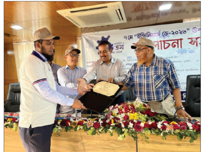
ডিপিডিসি আয়োজিত সেবা সপ্তাহ ২০২৩ এর উদ্বোধন অনুষ্ঠান