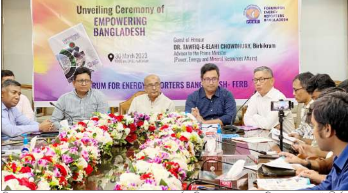
বিদ্যুৎ খাতে গত এক দশকে বাংলাদেশের অর্জন বিষয়ক “এম্পাওয়ারিং বাংলাদেশ” শীর্ষক প্রকাশনার মোড়ক উন্মোচন

গত ৩০ মার্চ ২০২৩ তারিখে ডিপিডিসি'র সম্মেলন কক্ষে ‘ফোরাম ফর এনার্জি রিপোর্টার্স বাংলাদেশ’ (এফইআরবি) এর আয়োজনে বিদ্যুৎ খাতে গত এক দশকে বাংলাদেশের অর্জন বিষয়ে “এম্পাওয়ারিং বাংলাদেশ” শীর্ষক একটি প্রকাশনা অনুষ্ঠান অনুষ্ঠিত হয়। মাননীয় প্রধানমন্ত্রীর বিদ্যুৎ, জ্বালানি ও খনিজ সম্পদ বিষয়ক উপদেষ্টা ড. তৌফিক-ই-ইলাহী চৌধুরী, বীরবিক্রম প্রকাশনা অনুষ্ঠানে প্রধান অতিথি হিসেবে উপস্থিত ছিলেন। প্রধান অতিথি তাঁর বক্তব্যে বৈশ্বিক প্রেক্ষাপটে বাংলাদেশের বিদ্যুৎ ও জ্বালানি খাতের অবস্থান ব্যাখ্যা করে বলেন, ‘সরকার বিদ্যুৎ কেন্দ্রগুলোতে গ্যাসের সরবরাহ বাড়িয়েছে যা বিদ্যুতের চাহিদা মেটাতে সহায়তা করছে। রাশিয়া-ইউক্রেন যুদ্ধ পরিস্থিতি সামনের দিনে জ্বালানির বৈশ্বিক বাজারে প্রভাব না ফেললে বিদ্যুৎ সরবরাহ পরিস্থিতি ভালো থাকবে’।