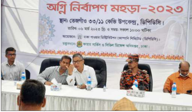
'ফায়ার সার্ভিস ও সিভিল ডিফেন্স অধিদপ্তর' এর তত্ত্বাবধানে ডিপিডিসি'তে অগ্নি নির্বাণ মহড়া আয়োজন

অনাকাঙ্ক্ষিত অগ্নিকাণ্ডের কারণে জান-মালের ক্ষয়ক্ষতি রোধকল্পে ঢাকা পাওয়ার ডিস্ট্রিবিউশন কোম্পানি (ডিপিডিসি)'তে নিয়োজিত এমপ্লয়ীদেরকে অগ্নিকাণ্ড সম্পর্কে সচেতনতা বৃদ্ধি এবং অগ্নি নির্বাণের বিভিন্ন কলা কৌশল হাতে-কলমে শিক্ষা দানের জন্য গত ০৬ মার্চ ২০২৩ তারিখে ডিপিডিসি'র গ্রিড নর্থ-২ দপ্তরের নিয়ন্ত্রণাধীন তেজগাঁও ৩৩/১১ কেভি উপকেন্দ্রে 'ফায়ার সার্ভিস ও সিভিল ডিফেন্স অধিদপ্তর' এর তত্ত্বাবধান ও সহযোগিতায় একটি অগ্নি নির্বাণ মহড়া অনুষ্ঠিত হয়।