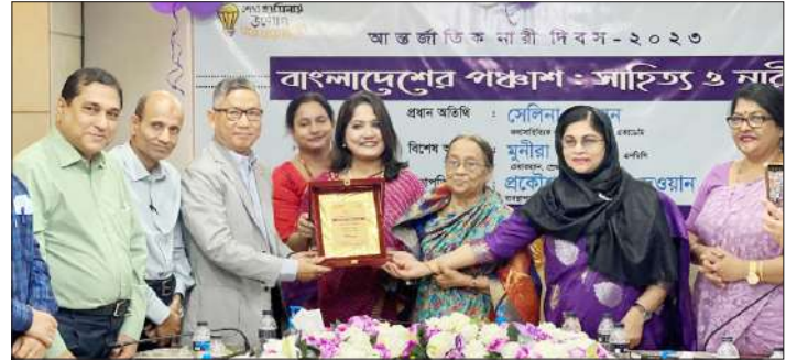
ডিপিডিসিতে নারী দিবস ২০২৩ উদযাপন